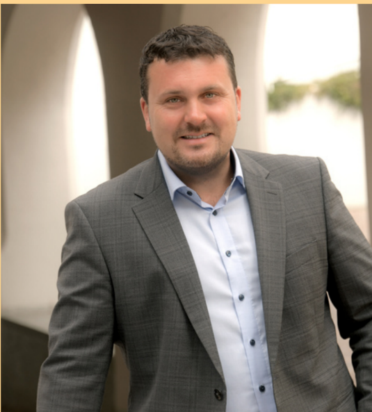
Christoph Schmidt, Erster Bürgermeister der Stadt Harburg (Schwaben)