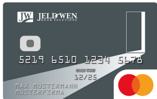
DesignCard der Jeld-Wen Deutschland GmbH & Co. KG.