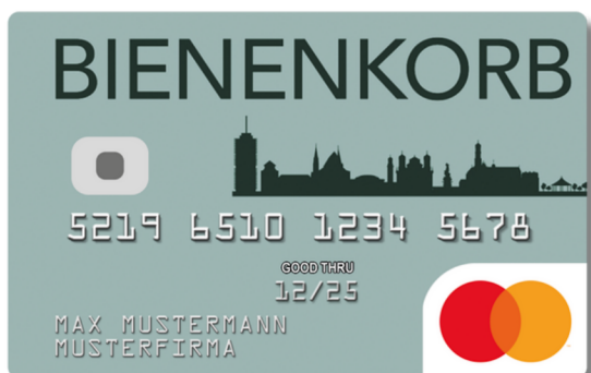
DesignCard der BIENENKORB Mode GmbH