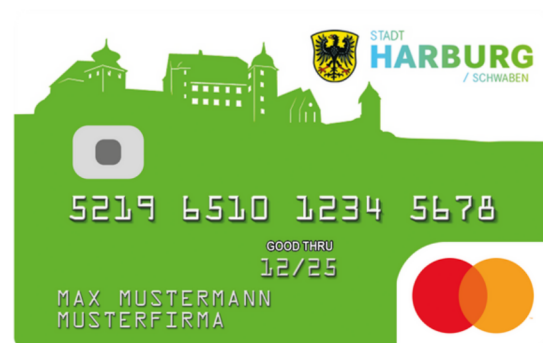
DesignCard der Stadt Harburg