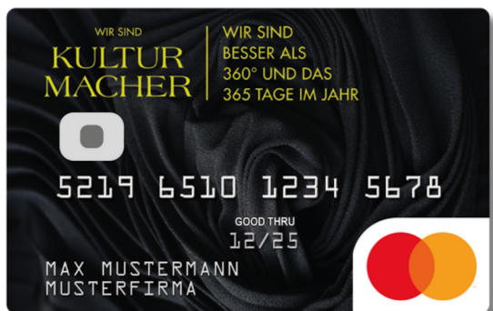
DesignCard der Wirsindkulturmacher GmbH.